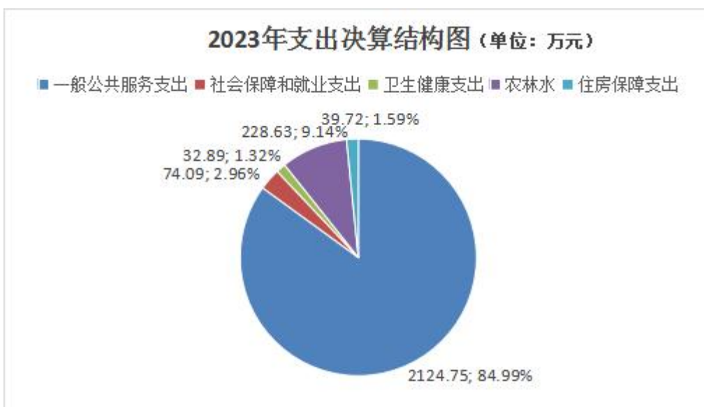
(图 6: 一般公共预算财政拨款支出决算结构)

2023 年一般公共预算财政拨款支出 2500.08 万元，主要用于以下方面:一般公共预算服务支出 2124.75 万元，占 84.99%; 社会保障和就业支出 74.09 万元，占 2.96%; 卫生健康支出 32.89 万元，占 1.32%; 农林水支出 228.63 万元，占 9.14%; 住房保障支出 39.72 万元，占 1.59%。(注: 数据来源于财决 01-1 表, 仅罗列本部门涉及的全部功能分类科目, 至类级)