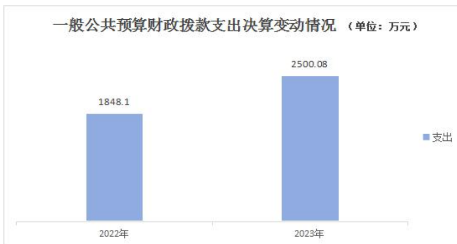
(图 5: 一般公共预算财政拨款支出决算变动情况)