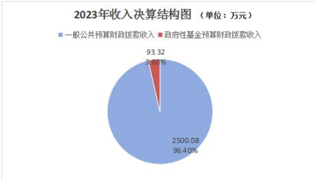
（图 2：收入决算结构图）