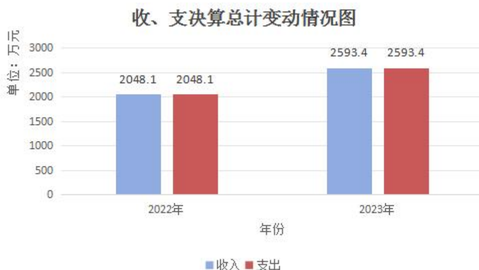
（图 1：收、支决算总计变动情况图）