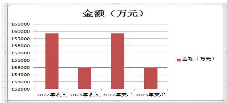
（图 1：收、支决算总计变动情况图）（柱状图）

2023 年度收、支总计均为 154911.63 万元。与 2022 年度相比，收、支总计各减少 4801.74 万元，下降 3%。主要变动原因是征收项目减少。